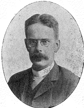
Fig. 14. Herm. Borries. af begge Dele. Navnlig de for Forstsvæsenet vigtige Bladhvæpse arbejdede han med og skrev flere Arbejder over;