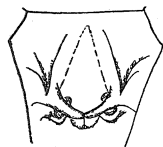
Fig. 2. Aeschna subarctica ♂.

Baand tydelig angivet med dets nederste Halvdel. Pletterne paa Bagkroppen viser ogsaa smaa Forskelligheder, men disse kan vanskelig anskueliggøres uden gennem Tegning. Hannens Genitalier paa andet Bagkropssegments Underside frembyder derimod gode og nøjagtige Skelnemærker, som Figurerne ogsaa udviser. Navnlig er de forreste Parringskroges Form meget forskellige; hos juncea er de spidse og stærkt krummede mod Spidsen; hos subarctica derimod butte imod Spidsen og kun svagt krummede. De bageste Parringskroge er stærkt udviklede hos juncea , men kun svagt fremtrædende hos subarctica .