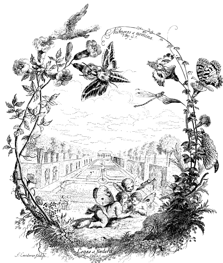
Fig. 2. Frontispice til 1. udgave (farvelagt) og 2. udgave (ufarvet). (Frontispiece of ed. 1 (coloured) and ed. 2 (uncoloured)).

Nok så vigtigt som at opklare disse bibliofile finesser forekommer det dog at blive klar over, hvor stor værdi man rent nomenklatorisk bør til-