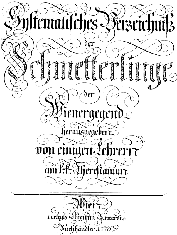
Fig. 3. Titelblad til 2. og 3. udgave. (T. P. of eds. 2 and 3).

Ganske tilsvarende blev det senere i et konkret tilfælde hævdet (Wolff, 1952: 56–59, at et navn som Tortrix ferrugana [Denis & Schiffermüller], 1775 (: 128), hvis fulde »beskrivelse« ordret lyder: »Unbek. (Raupe) . . . Rostbrauner W(ickler)« ikke bør tillægges nomenklatorisk betydning, når