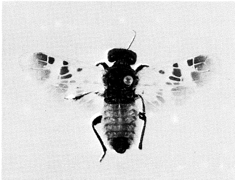
Cephalcia reticulata ♂

Hening Bettermann, Vældgårdsvej 27, 2820 Gentofte, telf. (01) 65 14 77