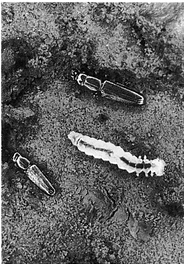
Larve og imagines af Prostomis mandibularis i en rødmuldet eg.