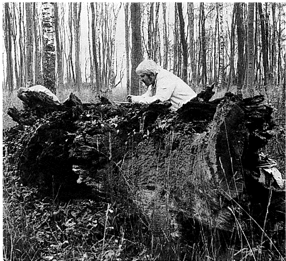
Levested: En ældgammel, rødmuldet egestamme ved Dyrnæs i Jægerspris Nordskov. (November 1994).