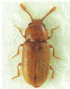
Fig. 3. Pteryngium crenatum (Fabr.) (1,8-2 mm).

Slægten kan indpasses i bestemmelsesnøglen i »Danmarks Fauna« (Hansen, 1950: 182) ved at erstatte nøglens punkt 3 med følgende: