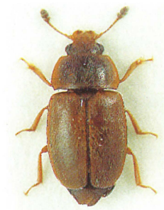
Fig. 2. Epuraea placida Mäkl. (2,5-3,2 mm).