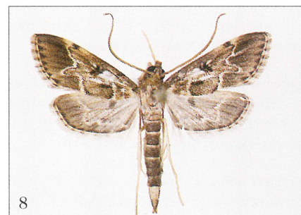
Fig. 1. Incurvaria pectinea (Hw.). Han, spraglet form, Dania, EJ, Sejs, 14 mm. – Fig. 2. Argyresthia trifasciata Stgr. Han, Dania, NEZ, Niverød, 11 mm. – Fig. 3. Lyonetia prunifoliella (Hb.). Hun, Dania, B, Dueodde, 10 mm. – Fig. 4. Monochroa ferrea (Frey). Han, Dania, LFM, Gedesby, 13 mm. – Fig. 5. Eulamprotes phaeella (Hckf. & Lngm.). Han, Dania, NWZ, Klint, 12 mm. – Fig. 6. Lobesia virulenta Bae & Komai. Han, Dania, NEZ, Asserbo, 12 mm. – Fig. 7. Clavigesta purdeyi (Durr.). Hun, mørk form, Dania, F, Stige, 14 mm. – Fig. 8. Duponchelia fovealis (Dup.). Han, Dania, EJ, Brund (indslæbt), 18 mm.