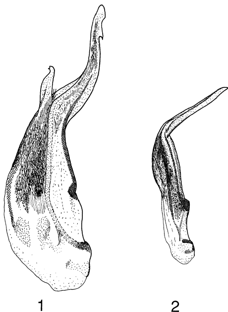
Fig. 1-2. Lathrobium , aedeagus set fra siden. - 1, L. boreale . - 2, L. castaneipenne .

104 (120). Lathrobium boreale Hochh. Lokaliteten »Rosenfelt« (jfr. Hansen, Kristensen et al., 1991) udgår (= castaneipenne ).