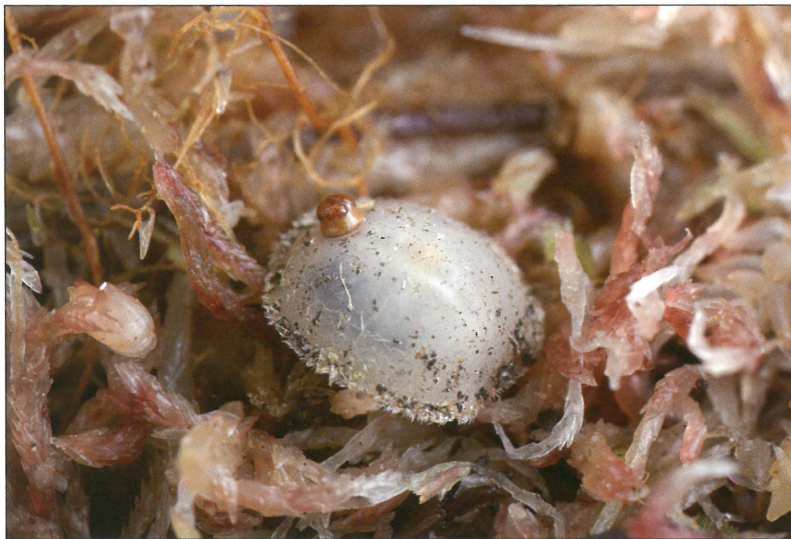
Fig. 2. Larve af Microdon myrmicae fundet i bo af Myrmica scabrinodis , Gjern Bakker, maj 2009.

danske Microdon -lokaliteter vurderes at være truede i større eller mindre grad, og alle de danske Microdon -arter er medtaget på rødlisten (Bygebjerg, 2004).