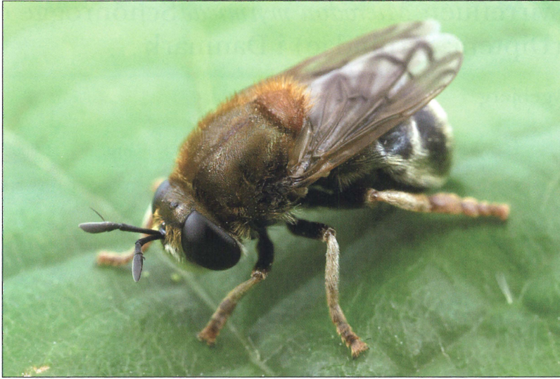
Fig. 1. Nyklækket imago af Microdon myrmicae.

Ifølge de britiske undersøgelser er M. myrmicae knyttet til myrearten Myrmica scabrinodis Nylander, 1846, mens M. mutabilis er fundet i boer af Formica lemni Bondroit, 1917 (Elmes et al., 1999; Schönrogge et al., 2002).