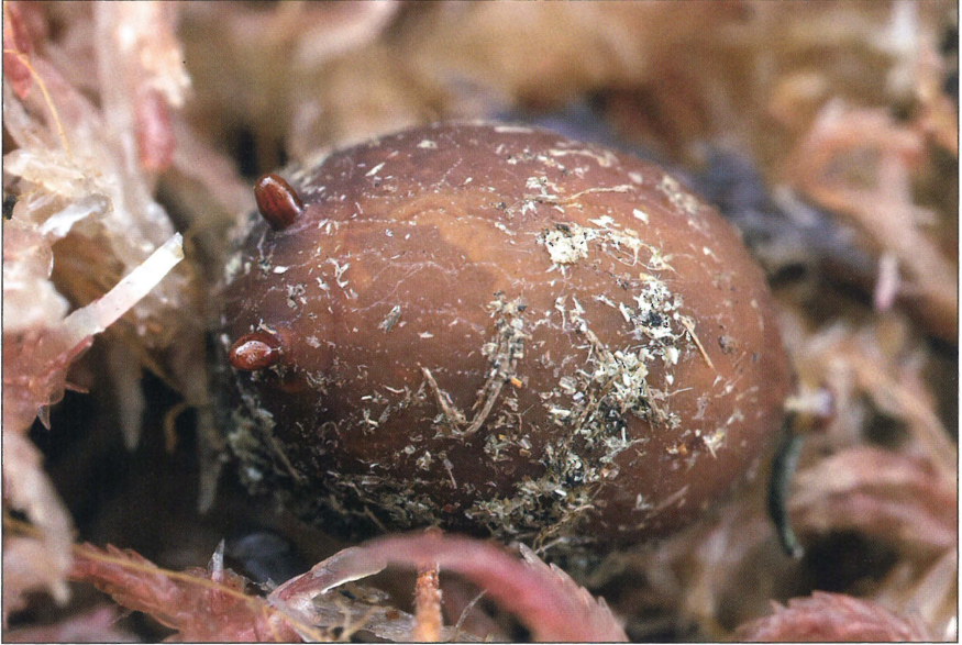
Fig. 3. Puppe af Microdon myrmicae fundet i bo af Myrmica scabrinodis , Gjærn Bakker, maj 2009.

Rald, 1967-1978). Gammelmosen, UB48 (E. Rald, 1980, 1981). Jægersborg Hegn, UB48 (E. Rald, 1979, 1980). Bøllemosen, UB48 (E. Rald, 1978).