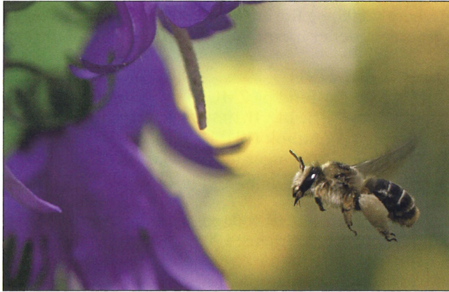
Fig. 6. Hun af Melitta haemorrhoidalis (Fabricius, 1775) på nælde-klokke ( Campanula trachelium ). Edithsvej, Glostrup (NEZ). 18.VII.2010.

Female Melitta haemorrhoidalis (Fabricius, 1775) on Campanula trachelium . Edithsvej, Glostrup (NEZ). 18.VII.2010.