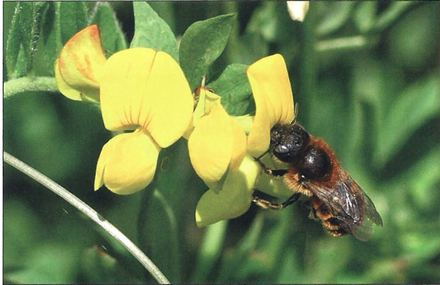
Fig. 1. Hun af Osmia aurulenta (Panzer, 1799) på kællingetand ( Lotus sp.). Hedeland ved Hedehusene (NEZ). Foto: Henning Bang Madsen, 31.V.2009.

Female Osmia aurulenta (Panzer, 1799) on Lotus sp. at Hedeland by Hedehusene (NEZ). Photo: Henning Bang Madsen, 31.V.2009.