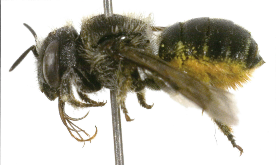
Fig. 5. Hun af Hoplosmia spinulosa (Kirby, 1802), Glatved Strand (EJ), 23.VII.2008, Hans Thomsen Schmidt leg.

Female Hoplosmia spinulosa (Kirby, 1802), Glatved Strand (EJ), 23.VII.2008, Hans Thomsen Schmidt leg.