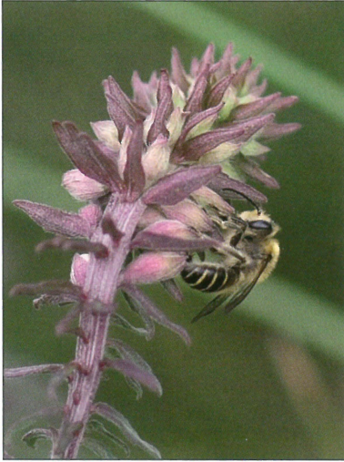
Fig. 3. Han af rødtopbien ( Melitta tricincta Kirby, 1802) på mark-rødtop ( Odontites verna ). Hedeland ved Hedeheusene (NEZ). Foto: Henning Bang Madsen, 26.VII.2009. Male Melitta tricincta Kirby, 1802 on Odontites verna at Hedeland by Hedeheusene (NEZ). Photo: Henning Bang Madsen, 26.VII.2009.