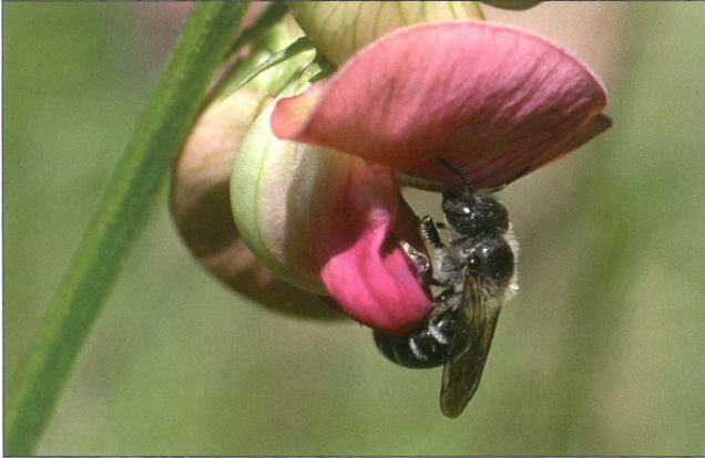
Fig. 8. Hun af Hoplitis claviventris (Thomson, 1872) på fladbælg ( Lathyrus sp.). Stubben, Hellerup (NEZ). Foto: Henning Bang Madsen, 24.VI.2009.

Female Hoplitis claviventris (Thomson, 1872) on Lathyrus sp. at Stubben, Hellerup (NEZ). Photo: Henning Bang Madsen, 24.VI.2009.