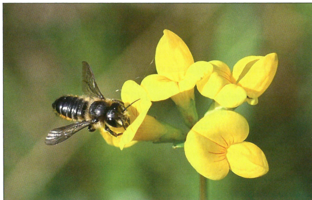
Fig. 7. Hun af Megachile versicolor Smith, 1844 på kællingetand ( Lotus sp.). Småsøerne ved Burresø (NEZ). Foto: Henning Bang Madsen, 06.VII.2009.

Female Megachile versicolor Smith, 1844 on Lotus sp. at Småsøerne by Burresø (NEZ). Photo: Henning Bang Madsen, 06.VII.2009.