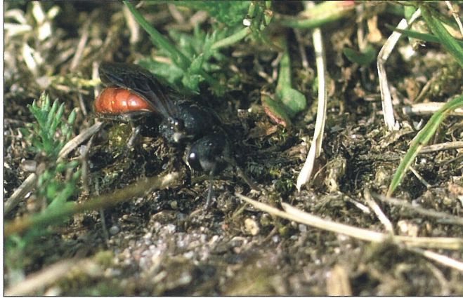
Fig. 4 Hun af stor blodbi ( Sphecodes albilabris (Fabricius, 1793)), Uhrehøje Plantage, Vesthimmerland (NEJ). 22.IV.2011.

Female Sphecodes albilabris (Fabricius, 1793), Uhrehøje Plantage, Vesthimmerland (NEJ). 22.IV.2011.