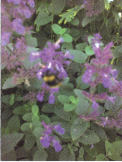
Fig. 3. Bombus lucorum (Linnaeus, 1761), Tórshavn, Streymoy, Færøerne. Foto: Dánial Jespersen, 03.IX.2009. Bombus lucorum (Linnaeus, 1761), Tórshavn, Streymoy, Faroe Islands. Photo: Dánial Jespersen, 03.IX.2009.

Litteratur er gennemgået for at finde tidligere oplysninger om humlebier fra Færøerne, ligesom oplysninger om honningbien Apis mellifera Linnaeus, 1758 er afsøgt.