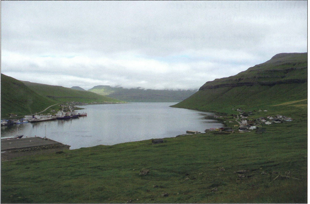
Fig. 1. Kollafjørður (tv) og Signabøur (th), Streymoy, Færøerne. Bemærk færgelejet. Foto: Jens-Kjeld Jensen, 05.VII.2010.

Kollafjørður (left) and Signabøur (right), Streymoy, Faroe Islands. Note the ferry berth. Photo: Jens-Kjeld Jensen, 05.VII.2010.