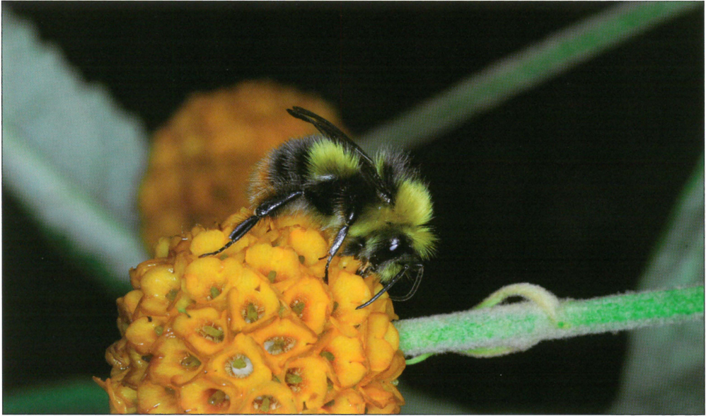
Fig. 4. Han af Bombus pratorum (Linnaeus, 1761) på sommerfuglebusk ( Buddleia globosa ) ved Signabøur, Strey moy, Færøerne. 05.VII.2010.

Male Bombus pratorum (Linnaeus, 1761) on Orange Ball Tree ( Buddleia globosa ) at Signabøur; Strey moy, Faroe Islands. 05.VII.2010.