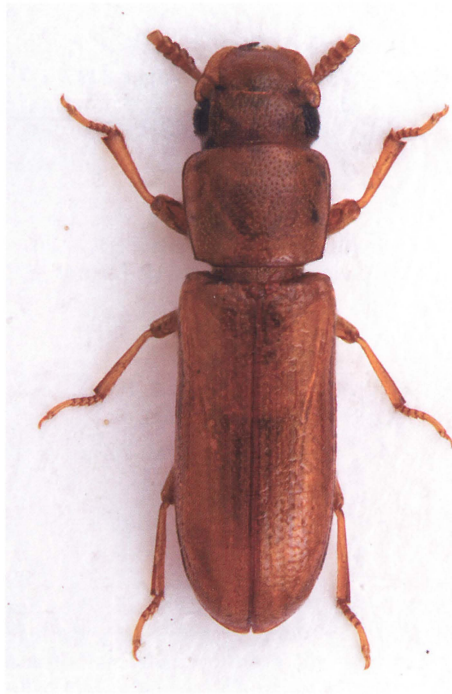
Fig. 5. Latheticus oryzae Waterh. Ca. 2,5 mm.

168 (280). Mycetophagus fulvicollis Fabr. NEZ: Jægersborg Dyrehave, yderligere 2 eks. 3.4.2010, under barken på et meget gammelt, dødt bøgetræ (L. Thomas – F&N) samt 1 eks. 14.6.2010, under bark på udgået bøgestamme (O. Martin leg., ZM coll.) (jf. Pedersen et al., 2008).