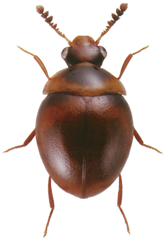
Fig. 2. Liodopria serricornis (Gyll.). Ca. 2,3 mm.