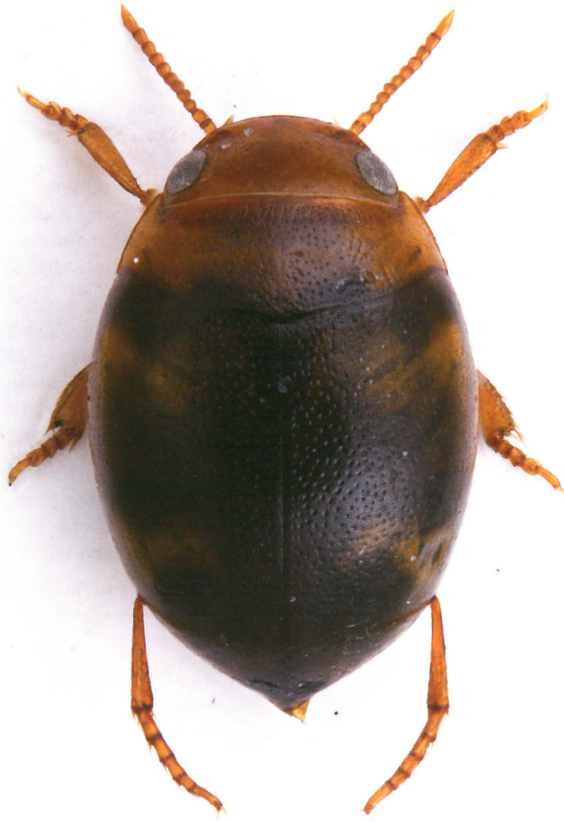
Fig. 1. Hydrovatus cuspidatus (Kunze). Ca. 2,9 mm.