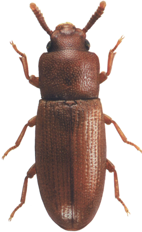
Fig. 6. Palorus depressus (Fabr.). Ca. 3 mm.