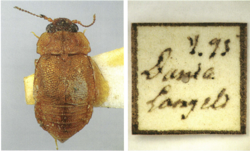
Fig. 3. Megarthrus hemipterus (Ill.). T.v. imago, fra det zoologiske museum i Lund, ca. 2,6 mm. T.h. etiket fra det pågældende ekspl.

95 (98). Phyllodrepoidea crenata Gglib. (jf. Hansen et al., 1999). WJ: Grene Sande 22.9.2011, 1 eks. ved ophængt ananas på brandhærget birk, senere iagttaget i antal samme sted (O. Vagtholm-Jensen).