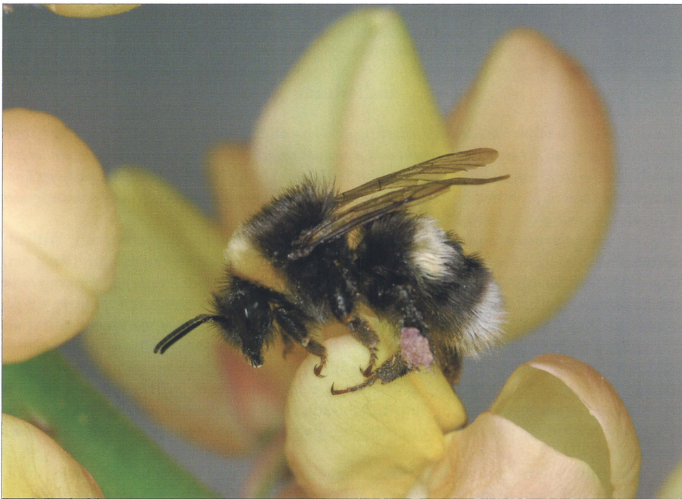
Fig. 1. Arbejder af Bombus lucorum (Linnaeus, 1761) på lupin ( Lupinus sp.) ved Runavík, Eysturoy, Færøerne. Foto: Jens-Kjeld Jensen, 28.VII.2011. Worker Bombus lucorum (Linnaeus, 1761) on Lupin ( Lupinus sp.) at Runavík, Eysturoy, Faroe Islands. Photo: Jens-Kjeld Jensen, 28.VII.2011.

Jens-Kjeld Jensen har igennem en lang årrække indsamlet og registreret insekter fra alle de 18 færøske øer (Jensen, 2001; Jensen, 2009; Jensen & Sivertsen, 2010; Tolsgaard & Jensen 2010). Efter et enkeltstående fund i 1887, blev humlebier første gang igen registreret i 2007. Ynglende humlebier blev først set i 2010. En egentlig eftersøgning af humlebier har ikke fundet sted før 2010, men da humlebier er markante og karismatiske insekter, er de næppe tidligere blevet overset. For at sikre så mange nye oplysninger som muligt, blev en efterlysning om observationer af humlebier bragt i færøske tv-udsendelser i 2010 og 2012, samt i radioen i 2011. For at beskytte de små bestande af begge arter, er kun et enkelt levende eksemplar blevet indsamlet som belæg. Alle øvrige indsamlinger var af døde eller døende individer. Data til nærværende artikel er primært baseret på observationer, hvoraf flere er dokumenteret ved fotos. En liste med alle observationer findes som appendiks sidst i artiklen. De indsamlede humlebier opbevares på Zoologisk Museum, København og på Føroya Náttúrugripasavn, Tórshavn, samt hos J-K. Jensen.