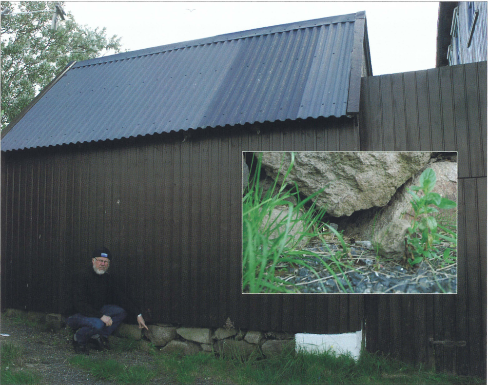
Fig. 3. Første fund af et humlebi-bo på Færøerne. Leitisvegur 101, Runavík, Eysturoy. Indsat foto af indflyvnings-hullet. Foto: Marita Gulkleit, 25.VIII.2012.

Det er nok ikke helt tilfældigt, at området omkring Skálafjørður blev det andet yngleområde for humlebier på Færøerne (se kort, Fig. 2). Der findes talrige store haver med mange blomstrende planter i området, og der bliver løbende plantet nye importerede planter, hvorved bl.a. humlebier kan blive indslæbt. Det først kendte eksemplar af Bombus lucorum (Linnaeus, 1761) fra Færøerne var en dronning, indsamlet i 2007 fra netop