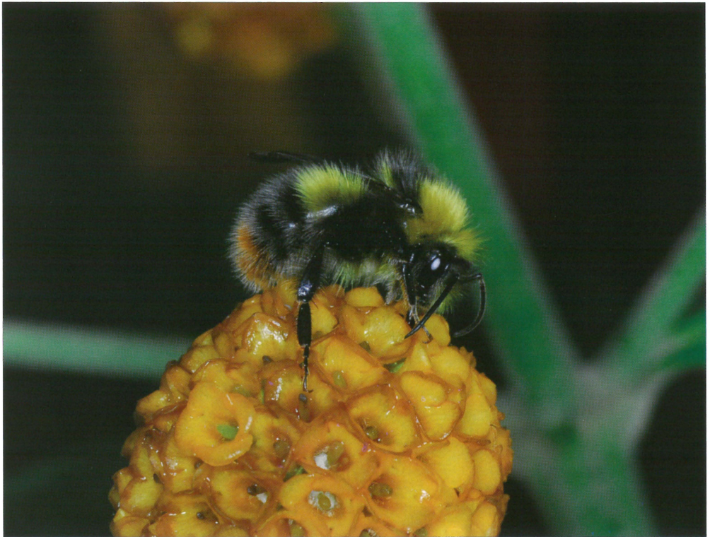
Fig. 4 Han af Bombus pratorum (Linnaeus, 1761) på sommerfuglebusk ( Buddleia globosa ) ved Signabøur, Streymoy, Færøerne. Foto: Jens-Kjeld Jensen, 05.VII.2010.

Med spredning af den først etablerede art, Bombus pratorum (Linnaeus, 1761), til endnu en bygd, ligger det klart at denne art trives i det færøske klima. Foråret 2012 var meget koldt og tørt, og antallet af individer i yngleområdet var derfor lavere i 2012, i forhold til de to foregående år. Trods det dårligere vejr, var der alligevel mange observationer i sæsonen 2012 (se appendiks nedenfor). Det synes på den baggrund derfor sikkert at arten vil kunne klare sig fremover. Det er naturligt med fluktuationer i antallet af individer hen over årene. Lignende forhold ses fra Danmark, hvor primært en meget fugtig sommer ofte fører til et lavere individantal det følgende år. Flyveperioden for arten er længere på Færøerne end i Danmark, fra sidst i april til hen i september. I Danmark har arten i reglen afsluttet sæsonen allerede i juni måned. Forskellen kan formentlig tilskrives klimaet, der er køligere på Færøerne, men lyset kan muligvis også spille ind: Øernes nordlige beliggenhed giver lange lyse døgn i sommermånederne og biernes aktivitetsperiode over døgnet vil forlænges, hvis nedbør og blæst ellers ikke forhindrer dem i at indsamle pollen og nektar. Humlebier er mest aktive på varme og solrige dage, som der imidlertid ikke er mange af i det kølige færøske klima. Men humlebier kan også fly-