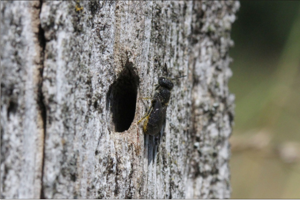
Fig 4. Heriades truncorum (Linnaeus, 1758) hun ved redehul i hegnspæl af flækket egestamme ved Davinde-Tarup grusgrave (F). Foto: Henning Bang Madsen 09.VII.2013.

Female Heriades truncorum (Linnaeus, 1758) at nest-entrance in fence post of oak trunk by Davinde-Tarup gravel pits (F). Photo: Henning Bang Madsen 09.VII.2013.