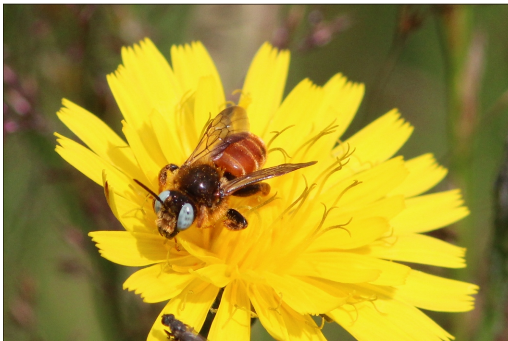
Fig. 2. Han af pragtbien Epeoloides coecutiens (Fabricius, 1775) ved Frøslev Mose (SJ). Foto: Jens Søgaard Hansen, 22.VII.2012.

Biologi: Begge danske fundsteder ligger tæt på kysten. Ved Dynt Mark blev arten fundet på skvalderkål ( Aegopodium podagraria ), der groede ved et levende hegn umiddelbart inden for Gammelmark klinten. Halk Skydeterræn, der er en del af Natura 2000 område nr. 112 (Naturstyrelsen, 2013), ligger lidt nordligere i Sønderjylland, lige ud til Lillebælt. Begge lokaliteter må betragtes som gode findesteder for bier. Ved fem ture til Dynt Mark 2006-2011 er registreret 54 arter af solitære bier ud over Andrena synadelpha ,