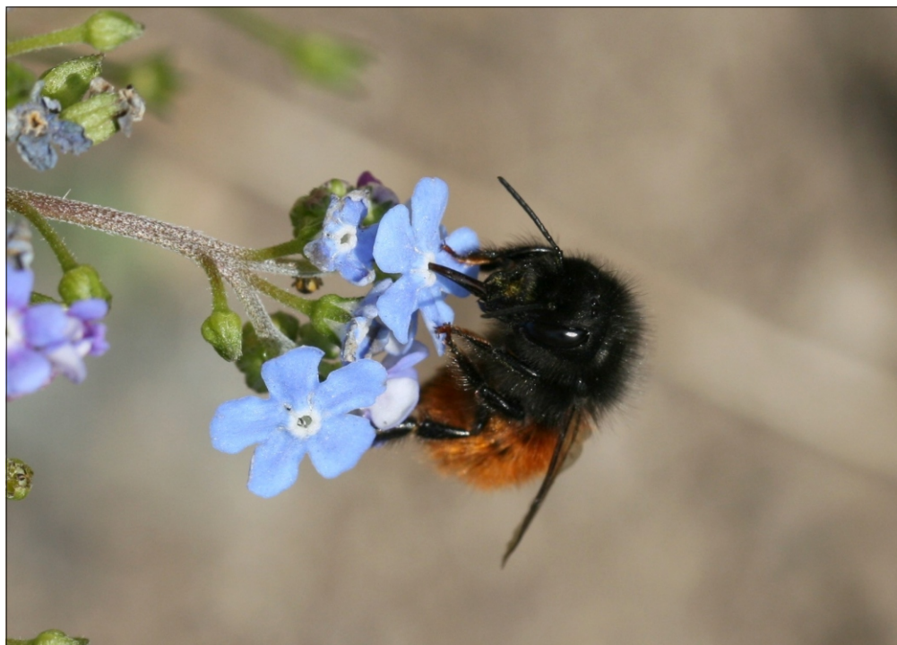
Fig. 3. Hun af murerbien Osmia cornuta (Latreille, 1805) på kærmindesøster ( Brunnera macrophylla ). Odense (F). 21.IV.2013.

Ved brug af nøglen i Scheuchl (2006) kommer man ligeledes uproblematisk til arten, især ved hanner, hvor det er første art der nøgles ud til. Her vælges antenne længere end thorax, samt thorax med gråsort behåring. Hunnerne nøgles i Scheuchl (2006) ud som første art relevant for Danmark, idet der vælges clypeus med fremstående »horn«.