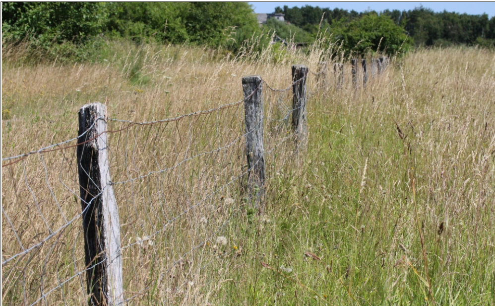
Fig 5. Hegnspæle af flækkede egestammer ved Davinde-Tarup grusgrave (F). Foto: Henning Bang Madsen 09.VII.2013.

Female Heriades truncorum (Linnaeus, 1758) at nest-entrance in fence post of oak trunk by Davinde-Tarup gravel pits (F). Photo: Henning Bang Madsen 09.VII.2013.