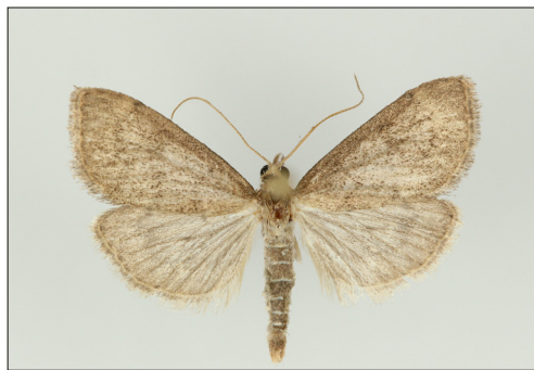
Fig. 18. Udea accolalis (Zell.) Han, B: Grisby, 17 mm.

Ecpyrrhorhoe rubiginalis (Hb.). NEZ: UB47 Søborg, 1 stk. 15.viii.2014 (K. Larsen); B: WB00 Årdsdale, 1 stk. 15.vii.2014 (P. Falck, J. Møller). Ny for NEZ.