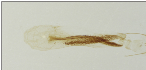
Fig. 16. Delplanqueia inscriptella (Dup.). Hun genitalier, gen. præp. Vilhelmsen 957.