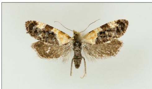
Fig. 10. Phtheochroa schreibersiana (Fröl.) Hun, B: Årsdale, 15 mm.

Acleris rufana (Den. & Schiff.). SZ: PG64 Sorø Sønderskov, i antal 19.ix.2014 (K. Gregersen).