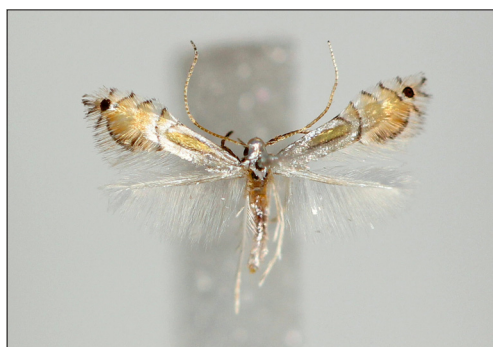
Fig. 2. Phyllocnistis citrella (Stt.) Han, B: Nexø, 5 mm.

[ Phyllocnistis citrella (Stt.)]. NEZ: UB26 Greve, antal la. og pup. 23.viii.2014 Citrus sp. (citron) (P. Falck); B: WB00 Nexø, antal la. og pup. 28.vi.2014 Citrus sp. (citron) (P. Falck). Ny indslæbt art for Danmark.