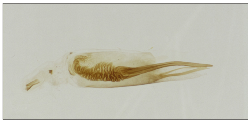
Fig. 14. Delplanqueia inscriptella (Dup.). Phallus, gen. præp. Vilhelmsen 958.