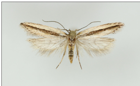
Fig. 4. Mirificarma interrupta (Curt.). Han, B: Sømarken, 16 mm.

Mirificarma interrupta (Curtis, 1827) placeres i den danske fortegnelse (Karsholt & Stadel Nielsen, 2013: 25) efter M. mulinella (Zeller, 1839). (P. Falck).