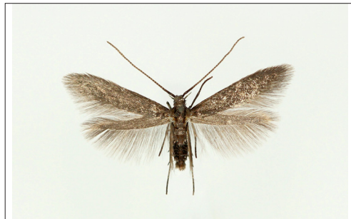
Fig. 5. Coleophora spiraella Rbl. Han, NEZ: Hvis-singe, 11 mm.

Coleophora spiraella Rebel, 1916 placeres i den danske fortegnelse (Karsholt & Stadel Nielsen, 2013: 26) før C. lutipennella (Zeller, 1838). (P. Falck).