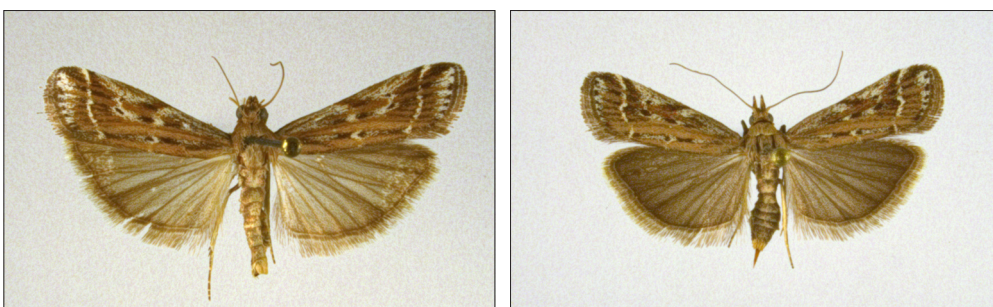
Fig. 13a-b. Pempeliella ornatella (D. & S.). 13a. Han, NEZ: Liseleje, 22 mm. Fig. 13b. Hun, NEZ: Melby Overdrev, 18 mm.