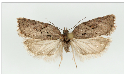
Fig. 9. Acleris schalleriana (L.) Hun, B: Slotslyngen, 18 mm.

Cnephasia genitalana Pierce & Metc. SJ: MF89 Sdr. Sejerslev, 1 stk. 18.vii.2014 (E. Palm). Ny for SJ.