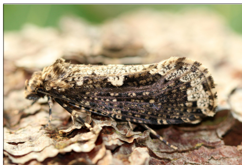
Fig. 1. Scardia boletella (F.) EJ: Randers Havn.

Det danske fund blev gjort på en oplagsplads for tømmer importeret fra Østeuropa (Gravesen, 2014). Ved gentagne indslæbninger kan det ikke udelukkes, at arten kan brede sig til omkringliggende skove, selv om en Fritz (2004) på baggrund af artens forekomst i Halland beregnede, at den har et spredningspotentiale på kun få hundrede meter pr. år. (O. Karsholt)