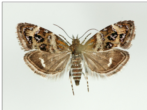
Fig. 7. Tebenna micalis (Mann, 1857). Hun, NEZ: Birkerød, 11 mm.

Genitalierne afbildes hos Diakonoff (1986).