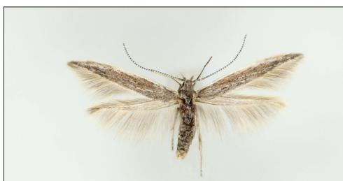
Fig. 6. Coleophora scabrida Toll. Han, NEZ: Melby Overdrev, 11 mm.

1849, der har mere hvidlig iblanding i forvingen. En sikker bestemmelse af ikke klækkede eksemplarer vil kræve undersøgelse af genitalierne. Disse afbildes hos Razowski (1990).