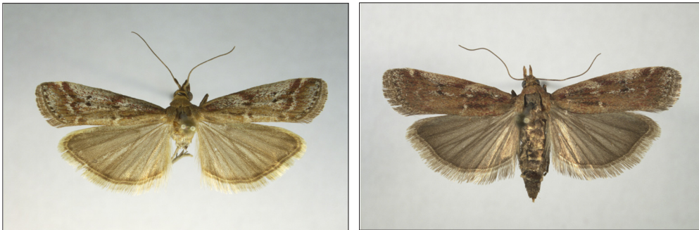
Fig. 11a-b. Delplanqueia inscriptella (Dup.). Fig. 11a. Han, B: Svenskehavn, 21 mm. Fig. 11b. Hun, LFM: Høvblege, 22 mm.