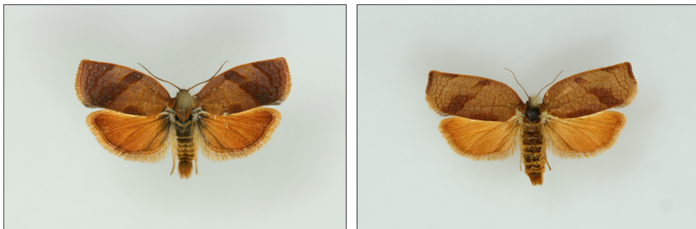
Fig. 8a-b. Cacoecimorpha pronubana (Hb.). Figa 8a. Han, NEZ: Vallensbæk, 18 mm. Fig. 8b. Hun, B: Nexø, 23 mm.

Også larven er variabel. Ifølge Fisher (1924, her refereret fra Bradley et al. , 1973) afhænger larvens farve af værtsplanten. Kroppen har forskellige grønne nuancer, og hoved og nakkeskjold kan være fra brungrøn til sortagtig. Den er yderst polyfag. Signorile (2012) skriver med henvisning til oplysninger fra CABI, at den er kendt fra 138 forskelli-