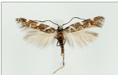
Fig. 3. Eteobalea anonymella (Riedl). Han, B: Årsdale, 11 mm.

Eteobalea anonymella (Riedl, 1965) placeres i den danske fortegnelse (Karsholt & Stadel Nielsen, 2013: 23) efter Pancalia nodosella (Bruand, 1850). (P. Falck).