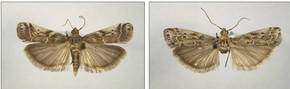
Fig. 12a-c. Delplanqueia dilutella (D. & S.). Fig. 12a. Han, NEZ: Melby Overdrev, 20 mm. Fig. 12b. Hun, NEZ: Melby Overdrev, 19 mm. Fig. 12c. Afvigende form, han, NEZ: Asserbo, 21 mm.