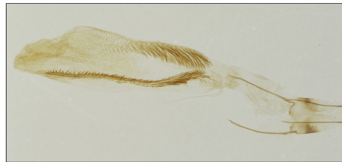
Fig. 17. Delplanqueia dilutella (D. & S.). Hun genitalier, gen. præp. Vilhelmsen 956.

Både D. inscriptella og D. dilutella er kendt fra Danmark siden 1800-tallet, og de behandles begge af van Deurs (1942) – førstnævnte under navnet » Pempelia dilutella Hb.« og sidstnævnte som » Pempelia subornatella Dup.« D. inscriptella er udbredt i den østlige del af Danmark (EJ, F, LFM, SZ, NWZ, NEZ og B). Fra Jylland kendes den kun fra EJ: Glatved. P. dilutella er mere udbredt i Danmark, men optræder ret lokalt. Den er efter 1959 fundet i distrikterne WJ, NWJ, NEJ, EJ, NWZ, NEZ og B. Der er desuden ældre fund fra SJ: Stensbæk Plantage, 1 stk. 5.vii.1952 (Worm-Hansen) og LFM: Møns Klint, 1 stk. 22.vi.1930 (E. Olsen) (begge ZMUC).