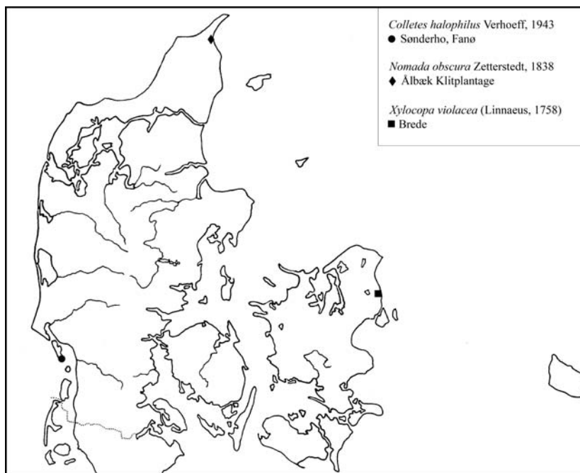
Fig. 1. Lokalteter for de her i artiklen publicerede fund af nye arter for Danmarks bi-fauna.

Localities for bee species recorded as new to the Danish bee fauna.