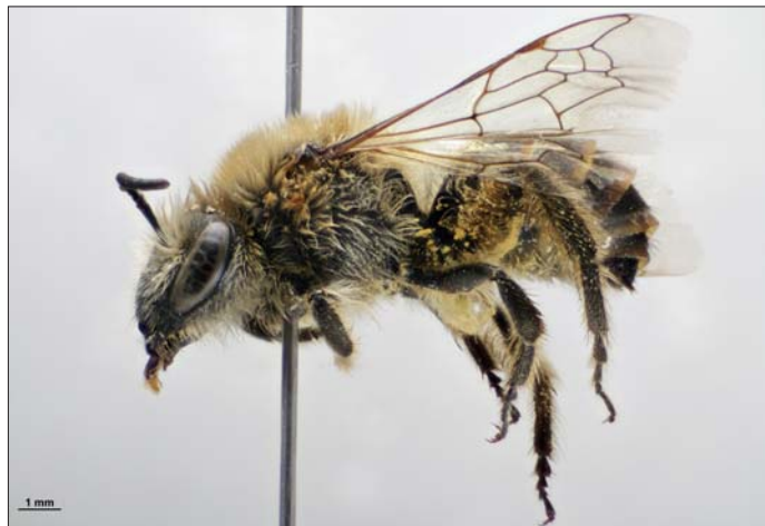
Fig. 2. Hun af silkebie Colletes halophilus Verhoeff, 1943, Sønderho, Fanø (WJ), 19.IX.2014, Hans Thomsen Schmidt leg.

Female Colletes halophilus Verhoeff, 1943, Sønderho, Fanø (WJ), 19.IX.2014, Hans Thomsen Schmidt leg.