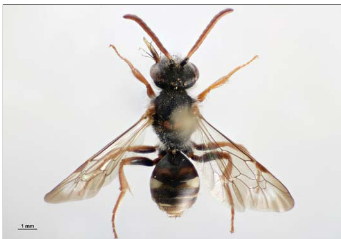
Fig. 3. Hun af hvepsebien Nomada obscura Zetterstedt, 1838, Ålbæk Klitplantage (NEJ), 06.V.2001, Rune Bygebjerg leg.

Female Nomada obscura Zetterstedt, 1838, Ålbæk Klitplantage (NEJ), 06.V.2001, Rune Bygebjerg leg.