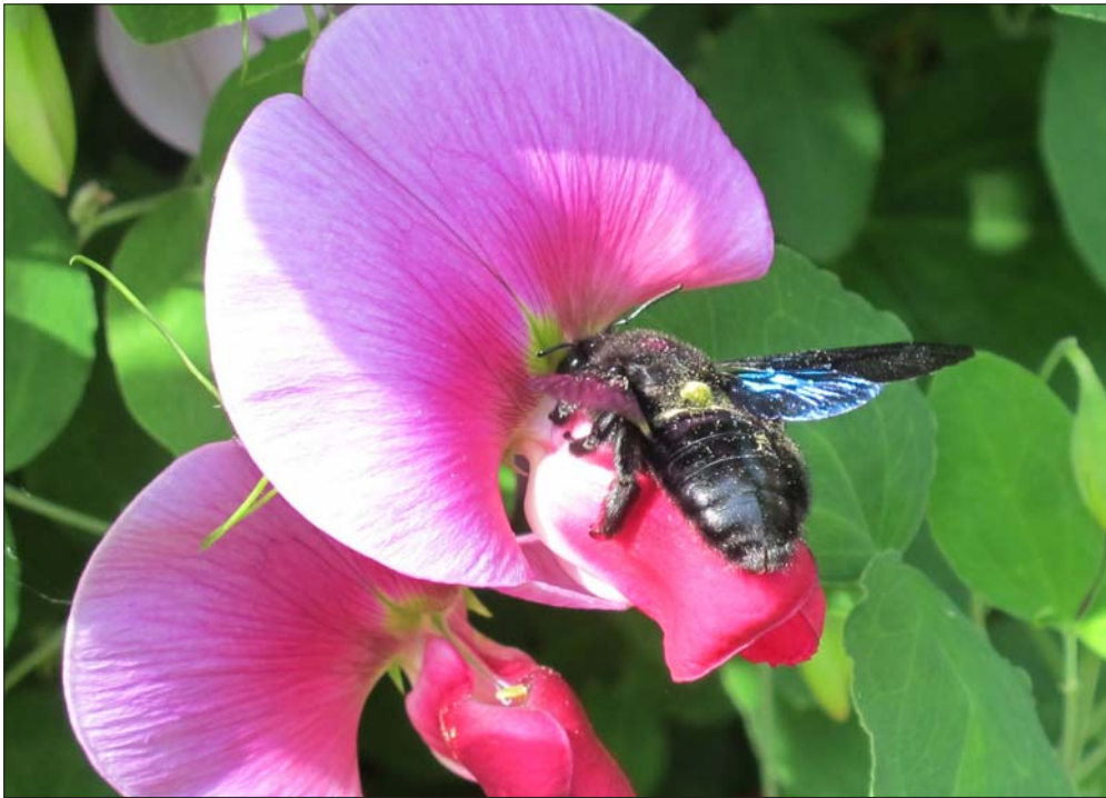
Fig 4. Hun af tømrrerbien Xylocopa violacea (Linnaeus, 1758) på afrikansk fladbælg ( Lathyrus tingitanus ), Brede (NEZ), 08.VI.2014. Female Xylocopa violacea (Linnaeus, 1758) on Tangier pea (Lathyrus tingitanus), Brede (NEZ), 08.VI.2014.

lebieer kan tømrrerbierne let kendes på deres behårede bagben uden pollenkurv (corbicula). Derudover er deres kraftige hoved ofte ligeså bredt som mesoscutum (øvre mellemkrop), i modsætning til det lidt smallere hoved på humlebieer.