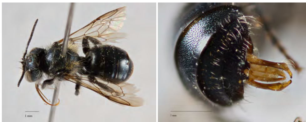
Fig. 2. Han af murerbien Osmia parietina Curtis, 1828, Rinkenæs Skov (SJ), 24.V.2015, Hans Thomsen Schmidt leg. Venstre: Habitus. Højre: Genitalie.

Hunner måler 8-9 mm og er med Amiet et al. (2004) forholdsvis nemme at bestemme. Til test af nøglen har forfatterne kun haft et par ældre, let blegnede, udenlandske (spanske) eksemplarer til rådighed. Der er to veje i nøglen, afhængig af om eksemplarets krop fremstår med eller uden metalglans. Behåringen er på friske eksemplarer overvejende rødbrun, sort på T3-5. Scopa på bagkrops underside (bugbørster) er helt sort. Det hjerteformede felt er mat. Ved tvivl om dette (kan fremstå relativt blankt) vil nøglens følgende karakterer hurtigt gøre det tydeligt at man er gået galt. T1-3 er glinsende med punktur på fladen, men bagrande er punktløse og på T2-3 med svag chagrinerung.