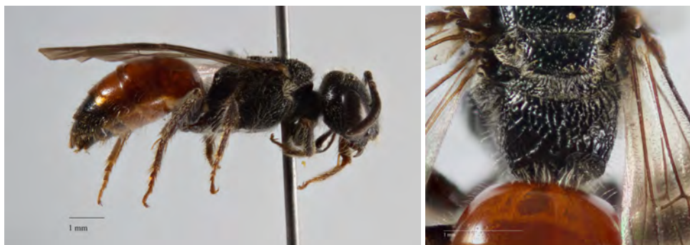
Fig. 3. Hun af blodbien Sphecodes rufiventris (Panzer, 1798), Arnager (B), 15.V.2015, Hans Thomsen Schmidt leg. Venstre: Habitus. Højre: Bemærk de fremtrædende tværstriber på siderne af propodeum.

Bestemmelse: Med den illustrerede nøgle i Amiet et al. (1999) nøgles ved begge køn uproblematisk frem til arten. Hunner måler 6-9 mm, har bagvinger med flere end 8 vingekroge langs forranden og med svagt buet cubital-ribbe. Hovedets bagkant er afrundet (uden skarp kant, set ovenfra) og hovedformen er oval (bredere end højt, set forfra). Mesonoten er spredt punkteret. Et markant nøglepunkt er de for arten karakteristiske glinsende og vinklede, regelmæssigt længdestribede mesopleurer (forkroppens sider). Bemærk også de fremtrædende tværstriber på siderne af propodeum (fig. 3).