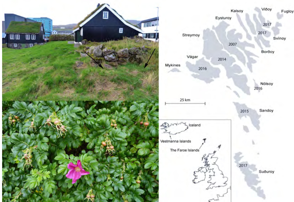
Fig. 2-4. Øvest til venstre. Fund af et Bombus lucorum humlebi-bo på Færøerne, Tórshavn, Streymoy. Nederst til venstre. Rosa rugosa busk med hyben, Nólsoy i 2017. Til højre. Spredningsforløb af Bombus lucorum på Færøerne.

Selv om der i den færøske udmark findes mange blomstrende Vaccinium spp., Empetrum spp. og Rubus saxatilis , ses der kun meget få bær. I de områder hvor Bombus lucorum er udbredt, ses en meget tydelig forandring på Rosa rugosa buskene, som tidligere kun havde meget få eller slet ingen hyben, men som nu hænger med hyben i store klaser (fig. 3). Også træer som guldragn får nu mange frøbælge i forhold til tidligere. Det må formodes, at artens tilstedeværelse i udmarken også vil påvirke den lokale (vilde) flora her.